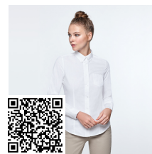
OXFORD WOMAN CM5068