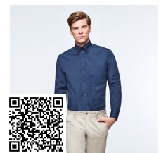
AIFOS L/S CM5504