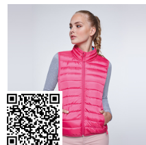
OSLO WOMAN RA5093