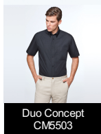
Duo Concept CM5503