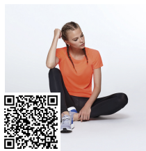
BAHRAIN WOMAN CA0408