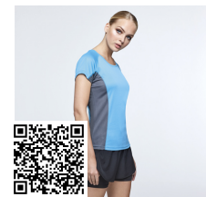
SHANGHAI WOMAN CA6648