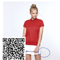
MONZHA WOMAN PO0410