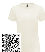
BASSET WOMAN CA6686