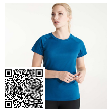
BAHRAIN WOMAN CA0408