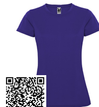
MONTECARLO WOMAN CA0423