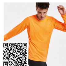
MONTECARLO L/S CA0415