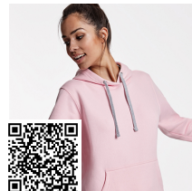
URBAN WOMAN SU1068