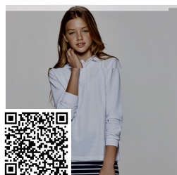
CARPE CHILD PO5008