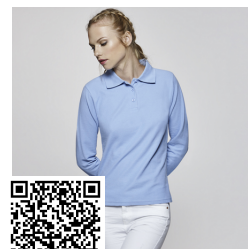
ESTRELLA WOMAN L/S PO6636