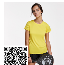
MONTECARLO WOMAN CA0423