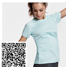
BAHRAIN WOMAN CA0408